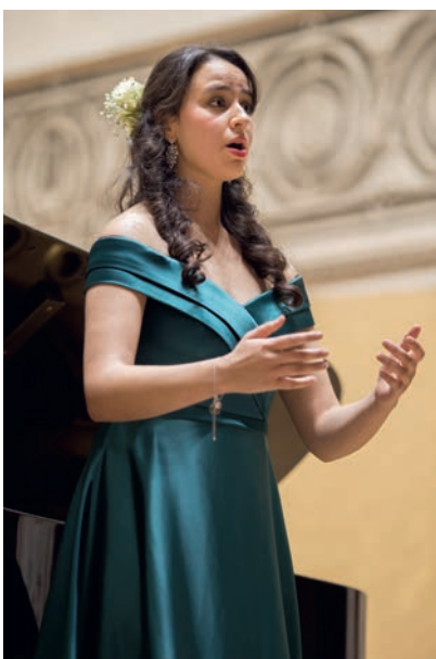
Itzel Devos Prijs 'zeer jong talent'