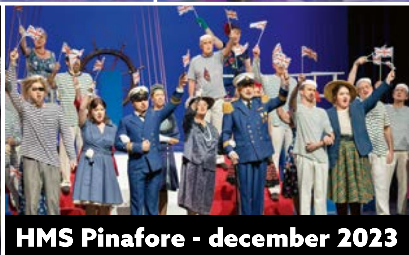
HMS Pinafore - december 2023