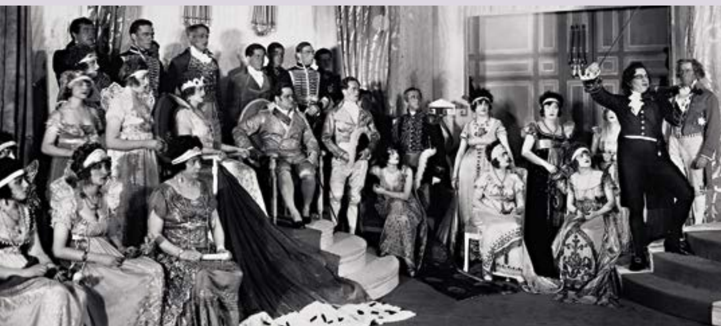
Richard Tauber, première van Paganini in Berlijn, 1926

In de voorstelling van het BOT halen we de personages uit de context van de historische figuren en de hofhouding in Lucca en laten de intriges zich afspelen in een theatermilieu in het Italië van de jaren dertig, de periode van het ontstaan van de operette.